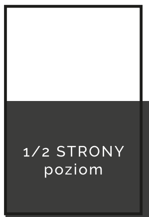
1/2 poziom 205x145 + 3mm spad