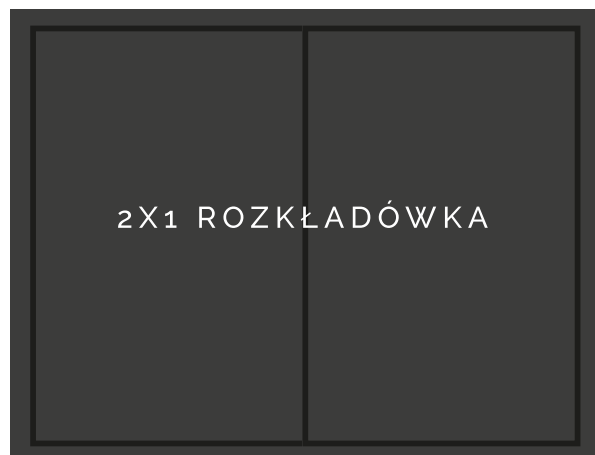
2X1 410x290 + 3mm spad