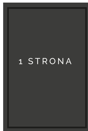
1/1 205x290 + 3mm spad