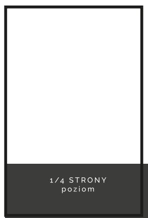
1/4 poziom 205x72,5 + 3mm spad